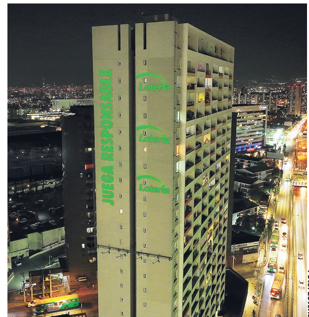
Activación del día de Juego Responsable realizada por Lotería en un edificio en Santiago.

su origen en 1921, cuando se empezaron a entregar los juegos lúdicos en el marco de la beneficencia, la responsabilidad y la transparencia, ya que en el centro de su quehacer están las personas y el compromiso de contribuir a la sociedad.