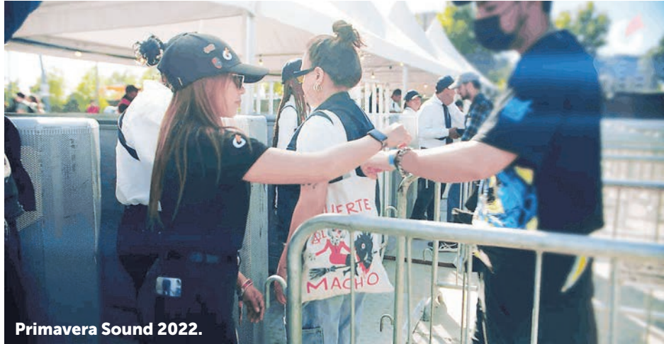
Primavera Sound 2022.

Con casi 5 millones de tickets vendidos, 1.250 eventos realizados y 14 megaconciertos en los estadios más importantes del país, la empresa cerró un 2022 fortaleciendo su posición como líder de industria.