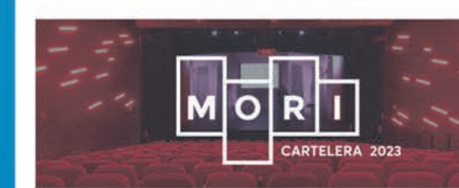
Teatro MORI Parque Arauco - Vitacura Recoleta - Bellavista