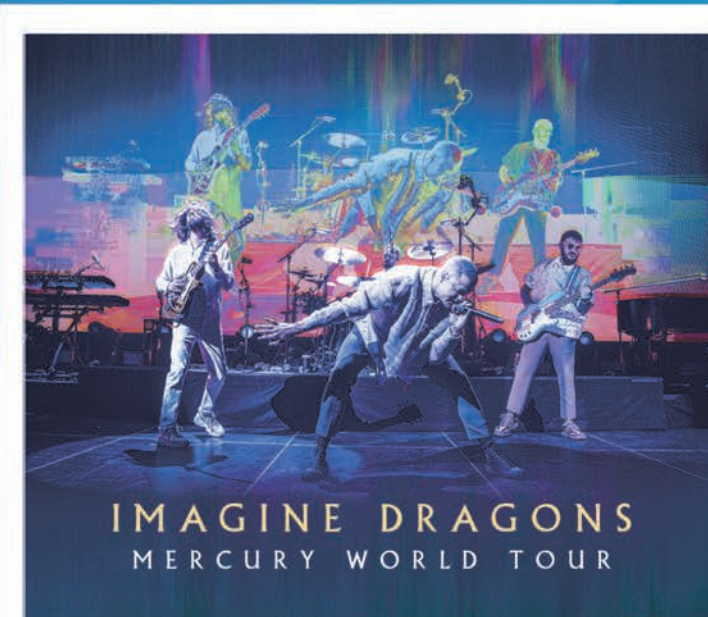
Imagine Dragons | Mercury World Tour 7 de Marzo | Estadio Bicentenario La Florida