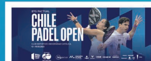
BTG Pactual Chile Padel Open Desde el 13 al 19 de Marzo Club Deportivo U. Católica