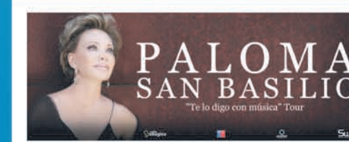
Paloma San Basilio "Te lo digo con música" Tour 17 de Marzo - Santiago 18 de Marzo - Viña del Mar