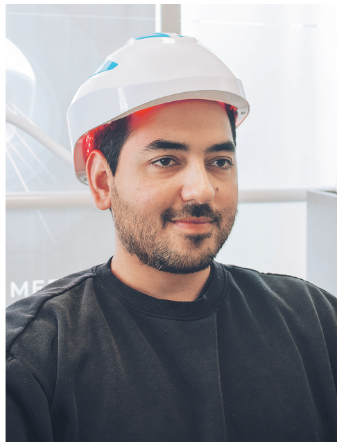
Tratamiento Láser Capilar.