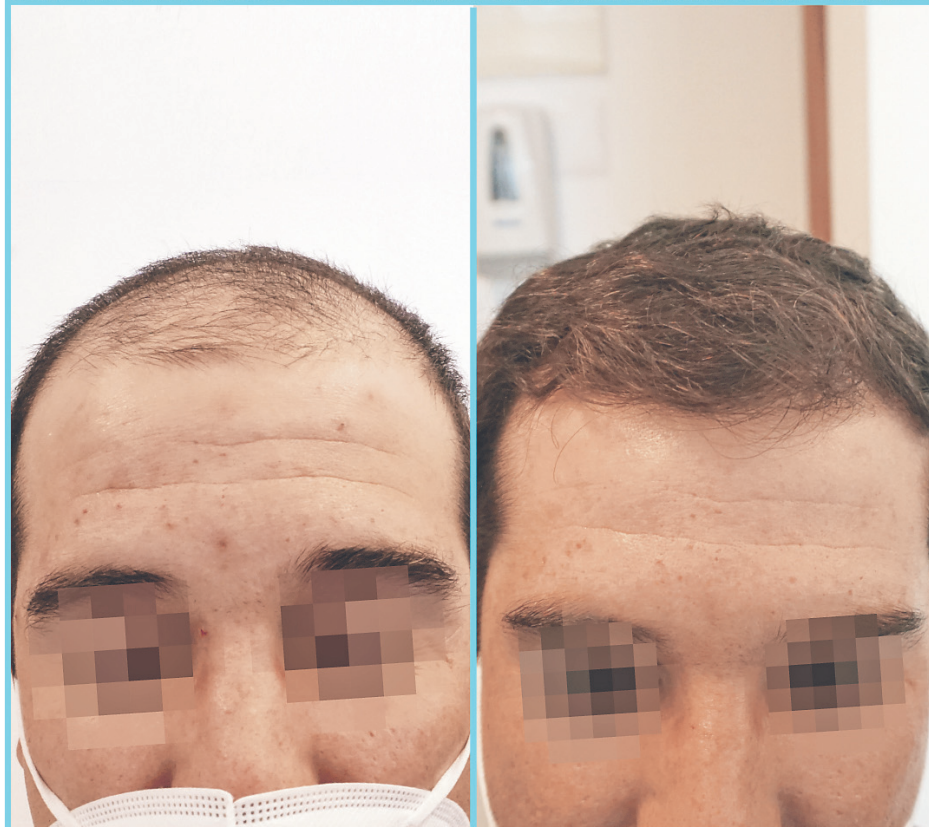
Antes y después.